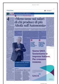
Peso: 1-4%, 7-55%