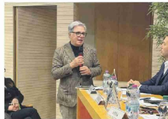
Alcuni momenti dell'incontro svolto all'interno della Stim di Cisterna

VONA: «L'OBIETTIVO È COSTRUIRE SOLUZIONI CONCRETE E CONDIVISE PER IL TESSUTO PRODUTTIVO LOCALE.»