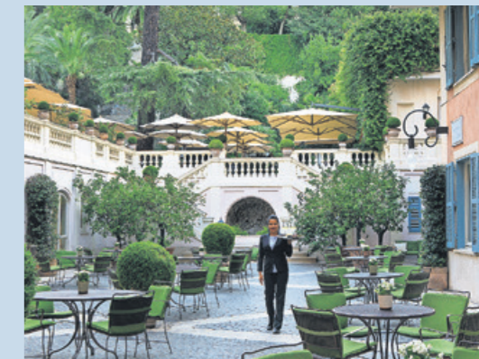
Exklusive Gastronomie, innen wie außen: „Stravinskij Bar“