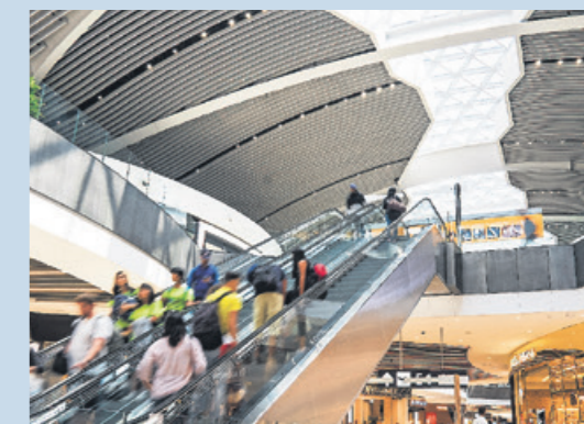
Exklusives Einkaufen auf über 10.000 Quadratmetern: „Tax Free Mall“

Selbst beim schönsten Einkaufsbummel fordern müde Beine und hungrige Mägen irgendwann zumindest eine Unterbrechung, etwa in einem Caffè oder Restaurant. Und auch diesbezüglich punktet Rom mit eleganten Locations wie dem ehrwürdigen „Antico Caffè Greco“ oder der preisgekrönten „Stravinskij Bar“. Wer da angesichts des bezaubernden Flairs gar nicht mehr weg will, bleibt einfach über Nacht; die Bar liegt im noblen „Hotel de Russie“. Berauscht von Vino und/oder dem Ausblick wissen auch die Restaurantgäste der „Trinità dei Monti“-Terrasse im „Grand Hotel Plaza“ sowie im michelinbesten „Imagò“ im „Hotel Hassler“ den Vorteil eines kurzen Heimweges zu schätzen.