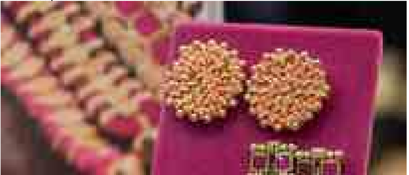
Trend gioielli, lusso creativo anche con materiali di scarto