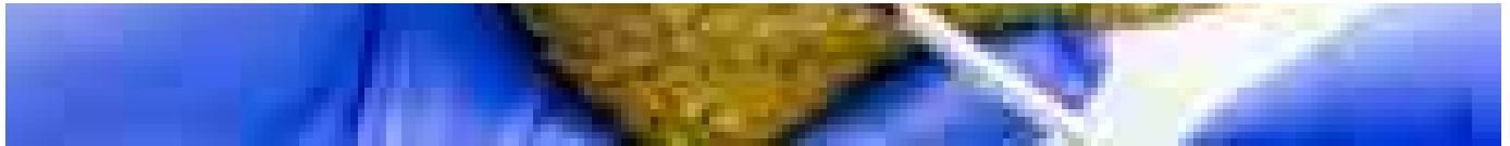
Cancro del pancreas, verso un vaccino che previene le recidive