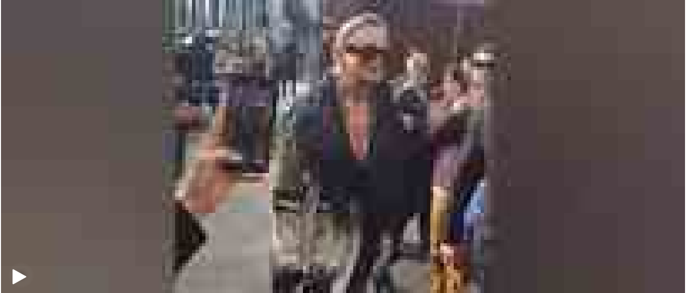
Sharon Stone ospite allo show di Antonio Marras a Milano