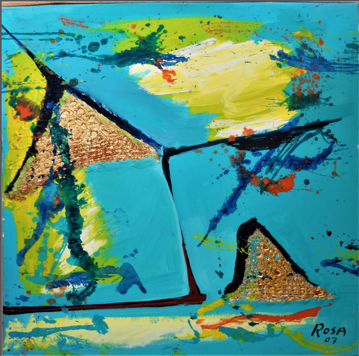
Hemingway marina, 2007 - 100x100 cm Acrilico su tela