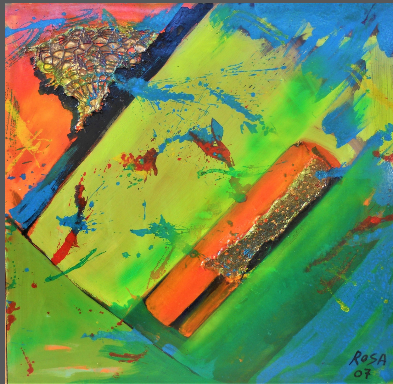
Tensione sonora, 2007 - 100x100 cm Acrilico su tela