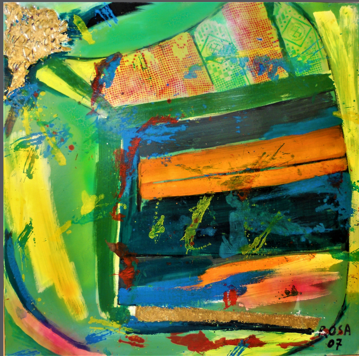
Composizione VI, 2007 - 100x100 cm Acrilico su tela