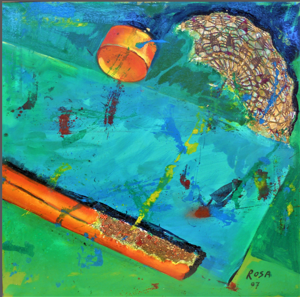
Continuità 2, 2007 - 100x100 cm Acrilico su tela