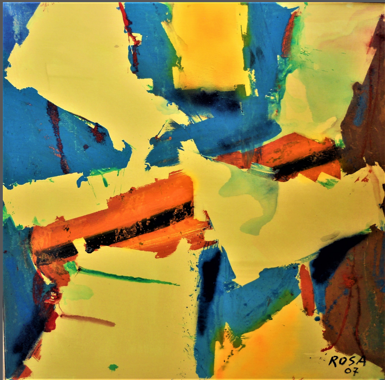
Bright fregments, 2007 - 100x100 cm Acrilico su tela