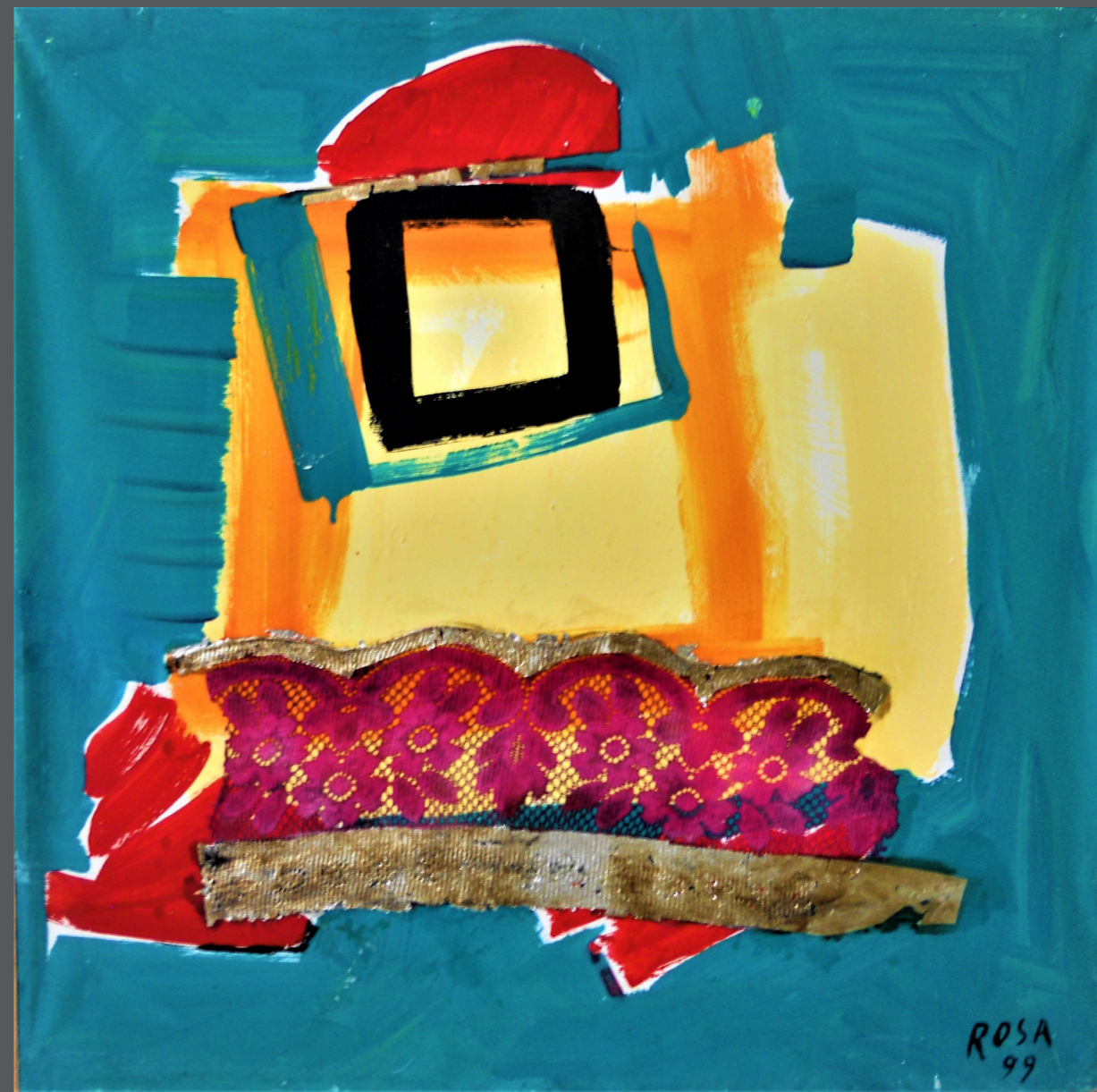
Oculata leggerezza, 1999 - 100x100 cm Acrilico su tela