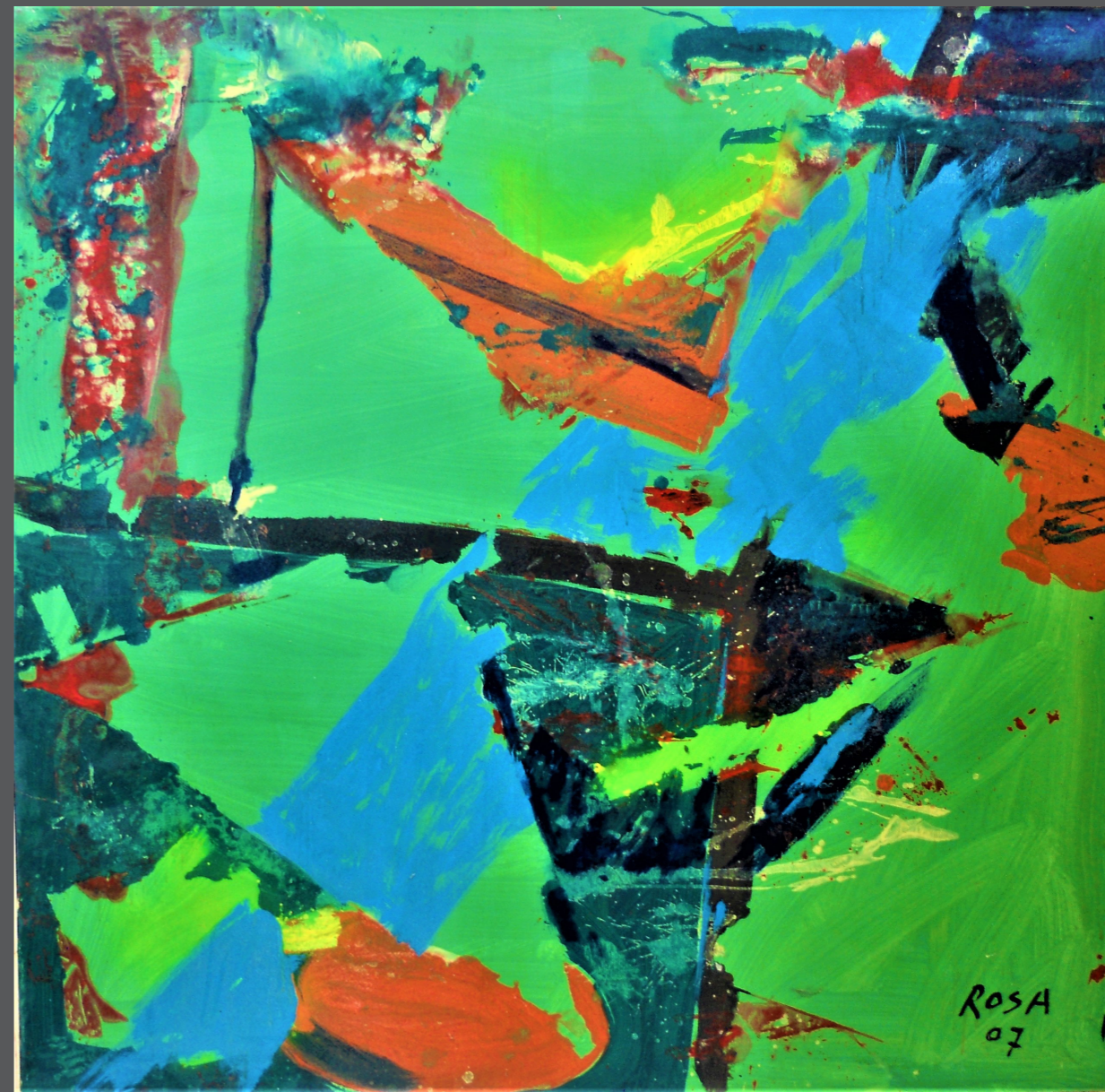
Deriva, 2007 - 100x100 cm Acrilico su tela