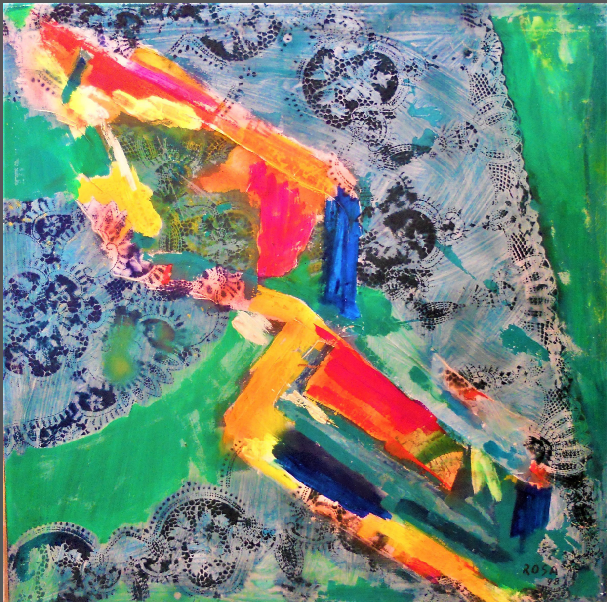
Blu e verde, 1998 - 100x100 cm Acrilico su tela