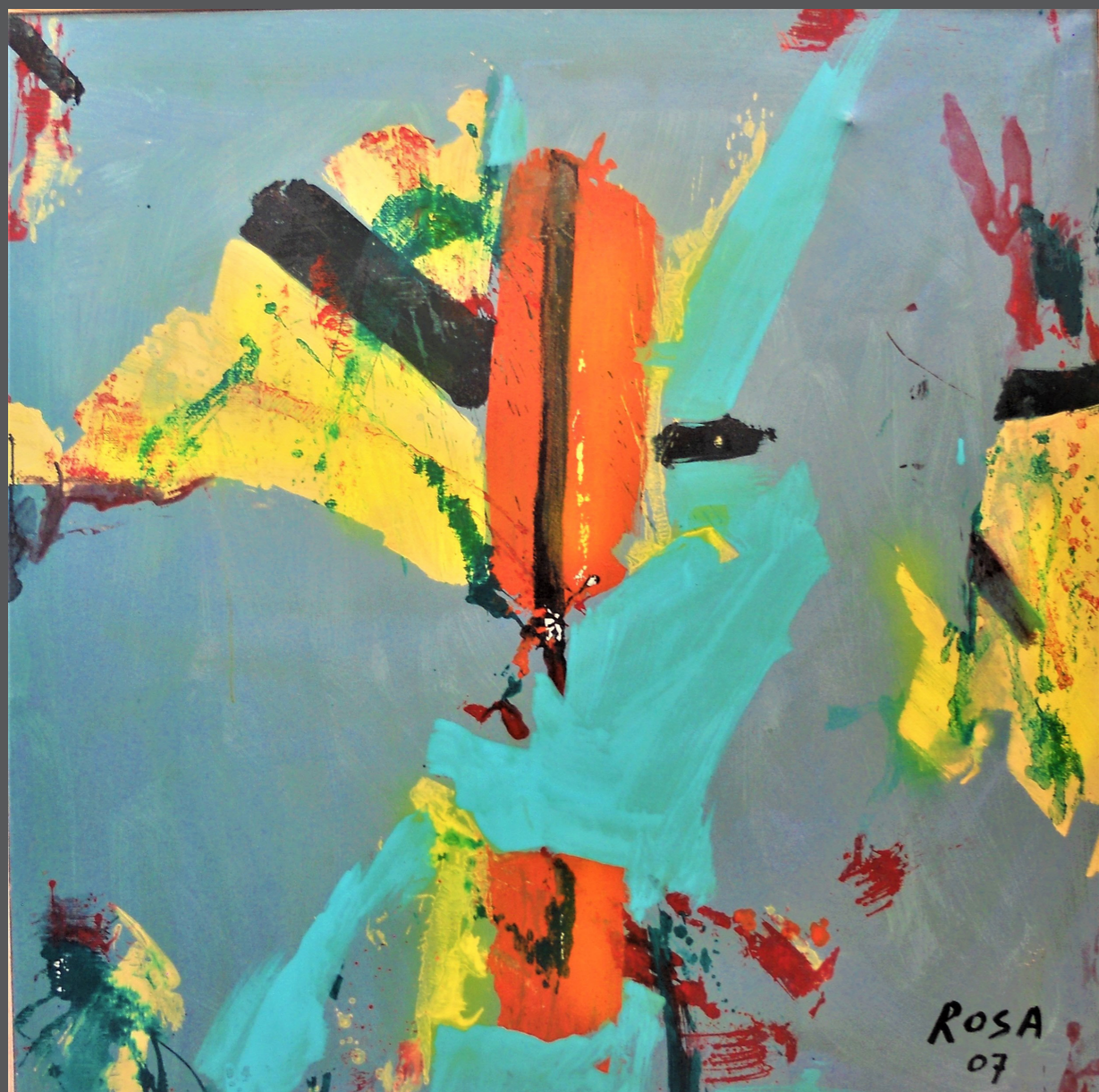
Celestial, 2007 - 100x100 cm Acrilico su tela