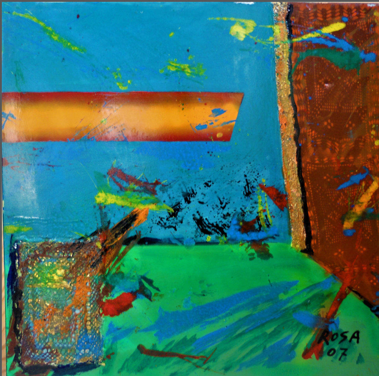
Sonorità, 2007 - 100x100 cm Acrilico su tela