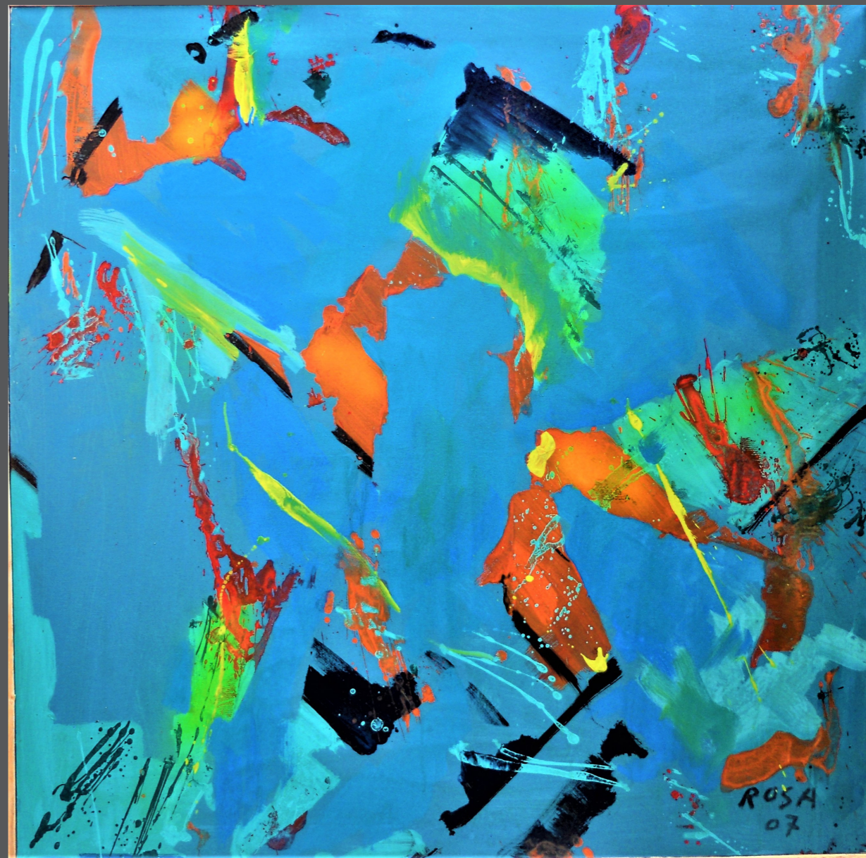
Blu salvo, 2007 - 100x100 cm Acrilico su tela