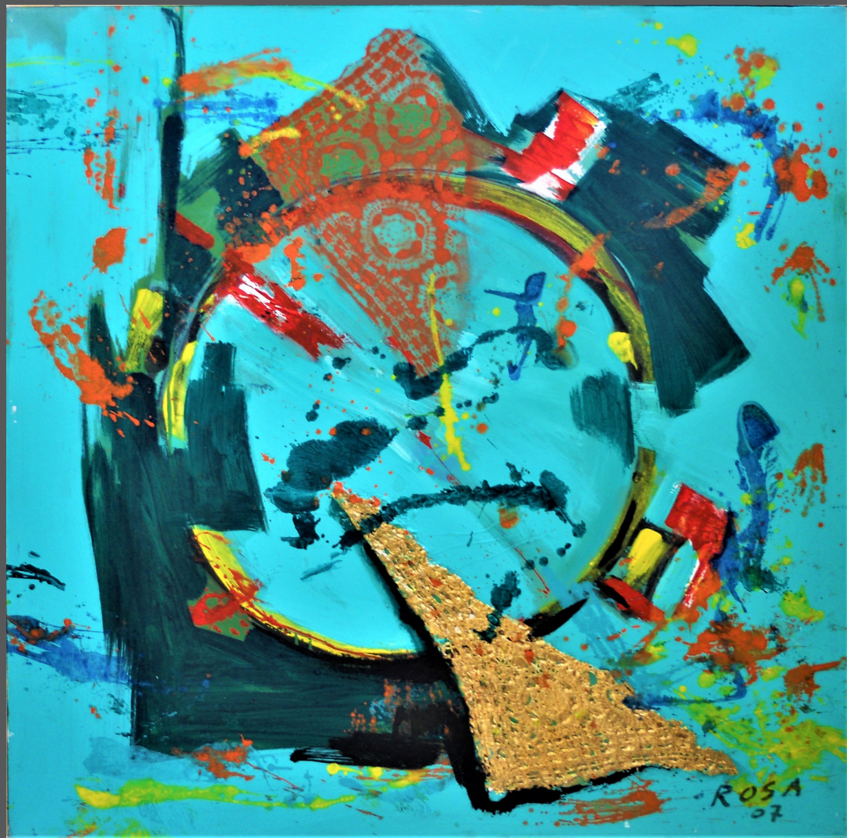
Rising, 2007 - 100x100 cm Acrilico su tela