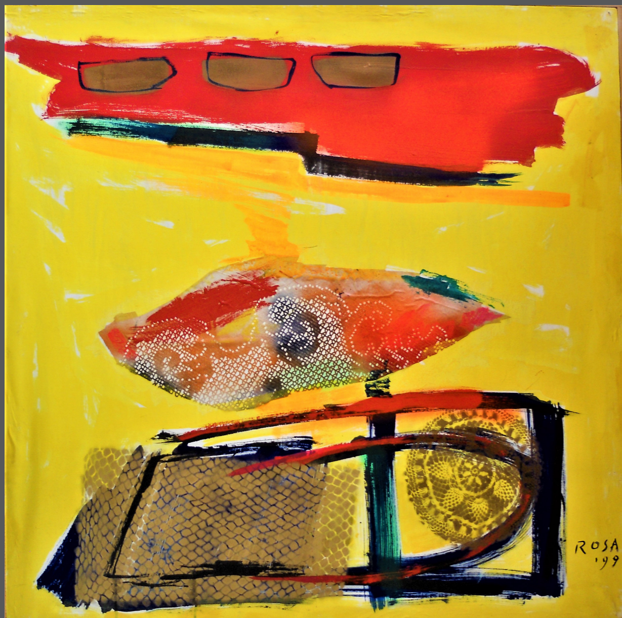
Cromie isolate, 1999 - 100x100 cm Acrilico su tela