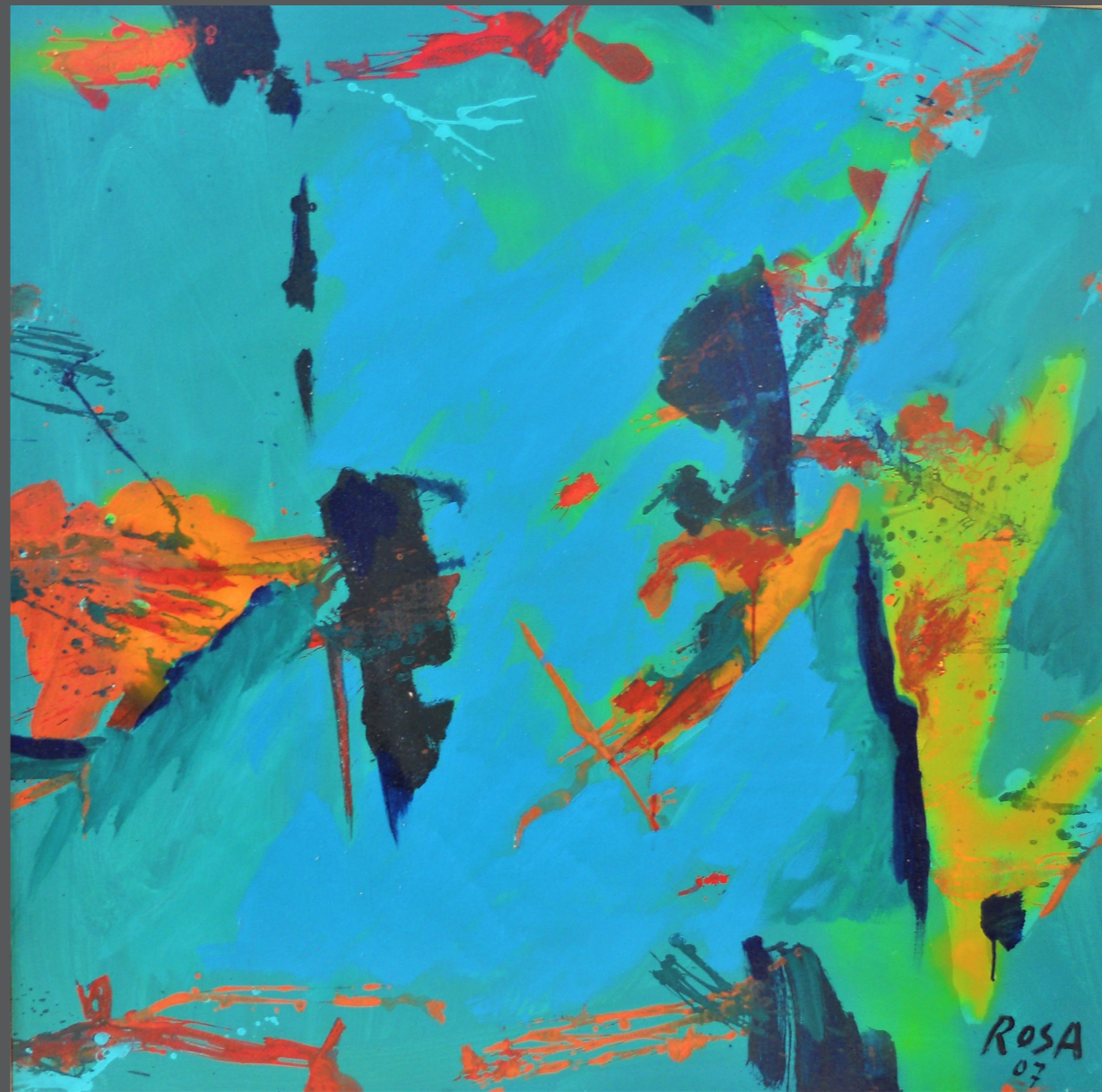
Assembling, 2007 - 100x100 cm Acrilico su tela