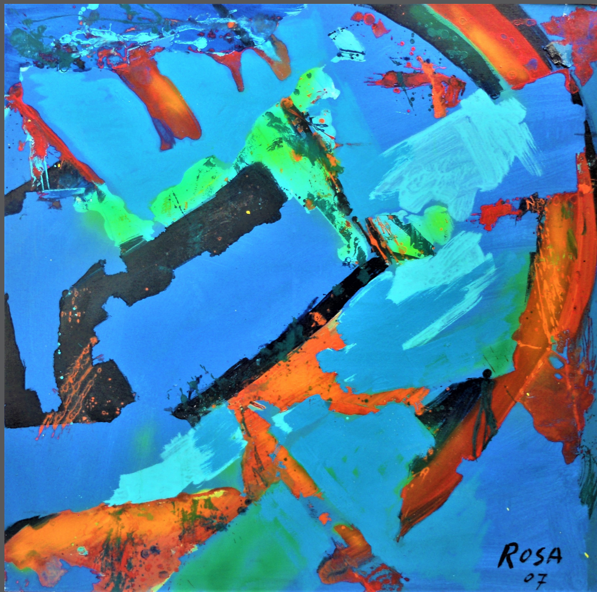
Dedalus, 2007 - 100x100 cm Acrilico su tela