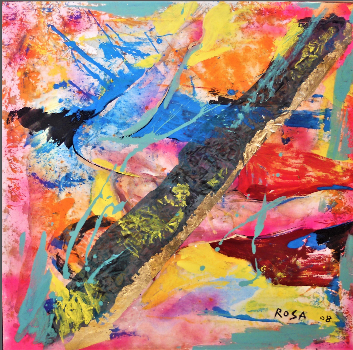
La nuit, 2008 - 100x100 cm Acrilico su tela