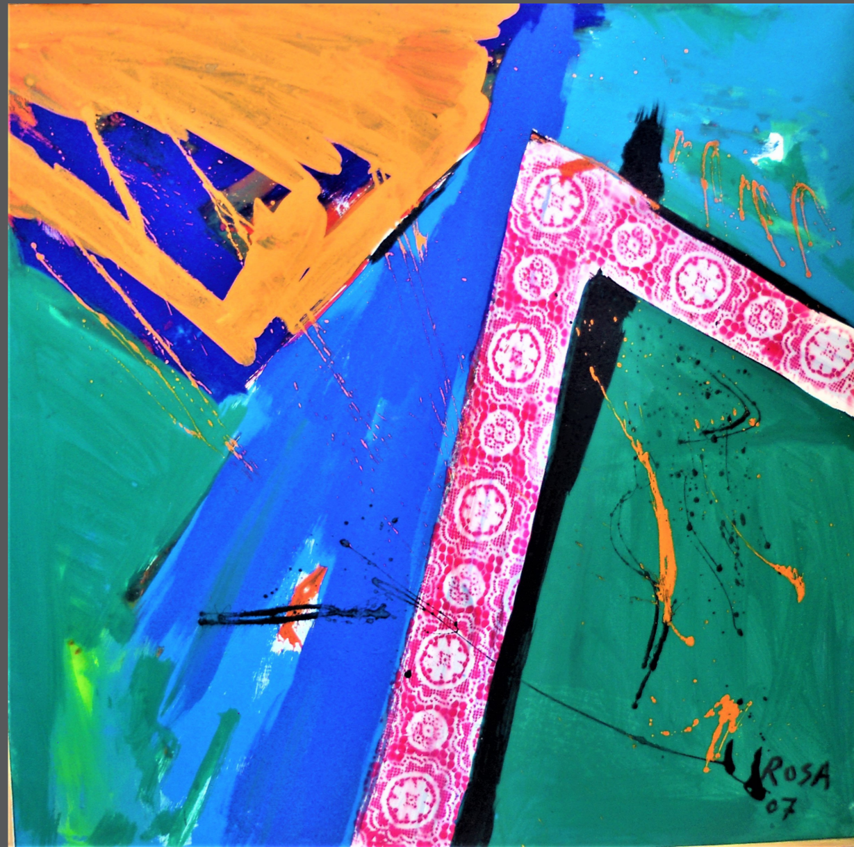
Continuità 1, 2007 - 100x100 cm Acrilico su tela