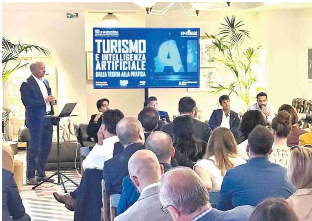
Un momento del talk sul turismo organizzato da Unindustria