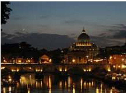
Centro storico di Roma