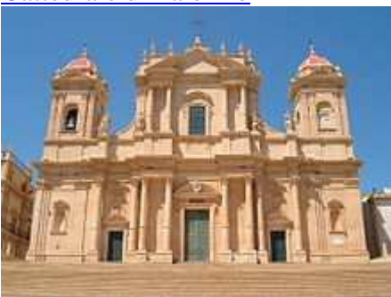
Cattedrale di Noto