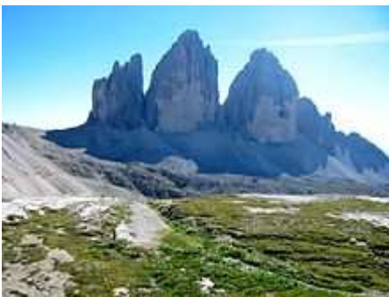
Dolomiti , le "Tre Cime di Lavaredo"