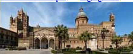
Cattedrale di Palermo