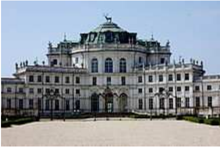
Palazzina di Stupinigi