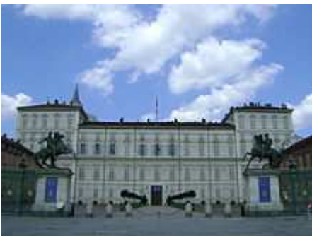
Palazzo Reale di Torino

Piemonte [modifica] | modifica wikitesto ]