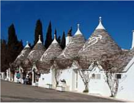
Trulli di Alberobello