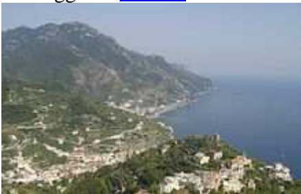
La Costiera amalfitana