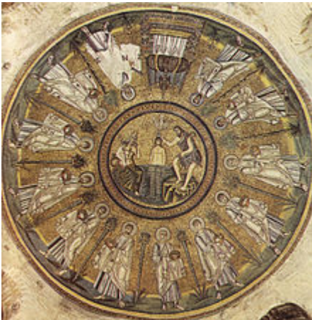
Battistero degli Ariani a Ravenna