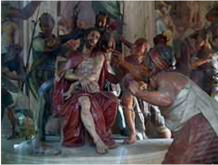
Statue del Sacro Monte di Varese