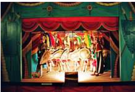
Teatro dei pupi