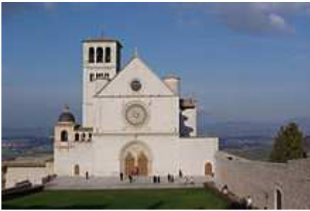
Basilica di San Francesco ad Assisi