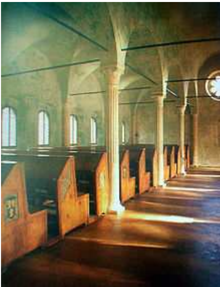
L'Aula del Nuti della Biblioteca Malatestiana di Cesena