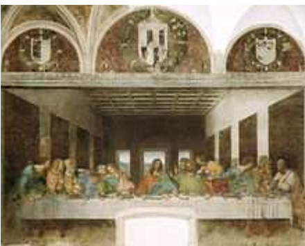
L'Ultima Cena di Leonardo, a Milano