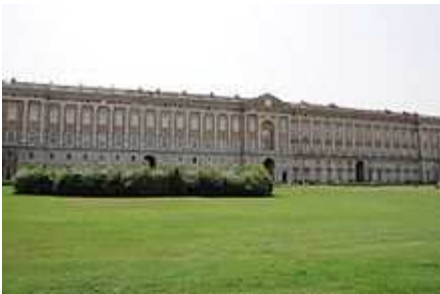
La Reggia di Caserta