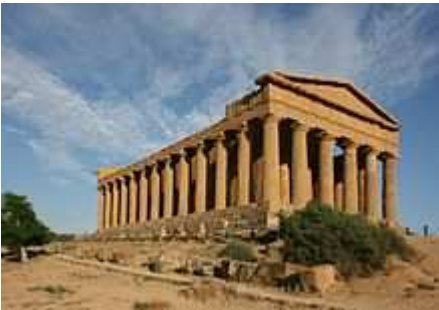
Valle dei Templi ad Agrigento