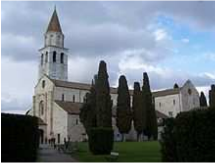
Basilica di Aquileia