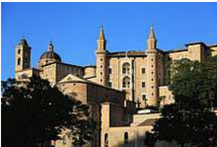
Palazzo Ducale di Urbino

Marche [modifica] | modifica wikitesto ]