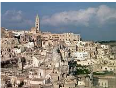
I Sassi di Matera