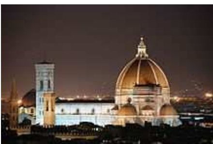
Centro storico di Firenze