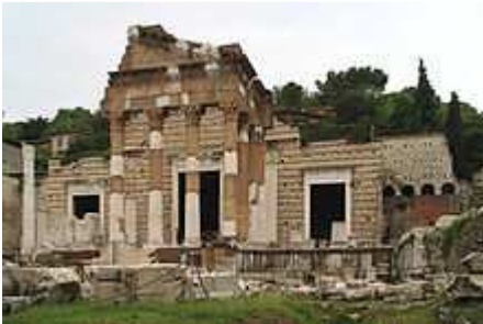
Il Capitolium nel foro romano di Brescia