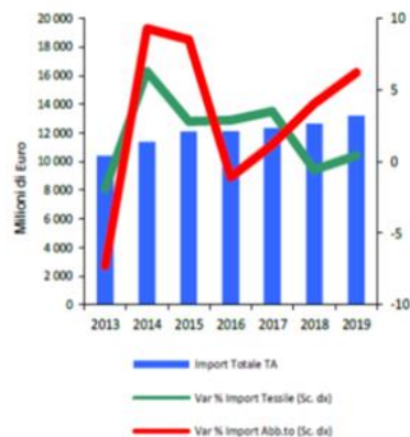
Figura 2.1 - Importazioni